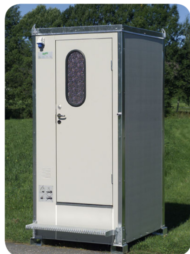
Tankkabine Mobiltoilette mit 500 Liter Fäkalientank