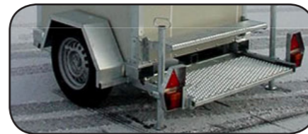
Fahrbares Untergestell für Einzelkabine

Multi-Toilettenwagen: Einachsiges, gebremstes, galvanisiertes Untergestell mit Anhängervorrichtung für 50mm Anhängerkupplung. Das Gestell ist bei der Lieferung vom TÜV abgenommen und darf mit 80 km/Stunde gefahren werden.