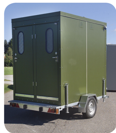
Multi-Toilettenwagen Mobiltoilette mit fahrbarem Untergestell und vier Toilettenräumen.