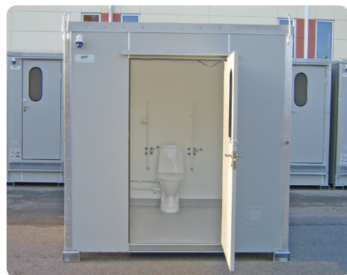
Beh.WC-Kabine Toilettenkabine mit einem grösseren Beh. WC-Raum - für den Anschluss ans Frisch- und Abwassernetz.