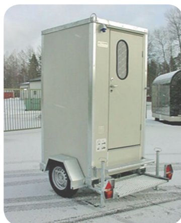
Einzel-Toilettenwagen mit 500 Liter Fäkalien-tank .