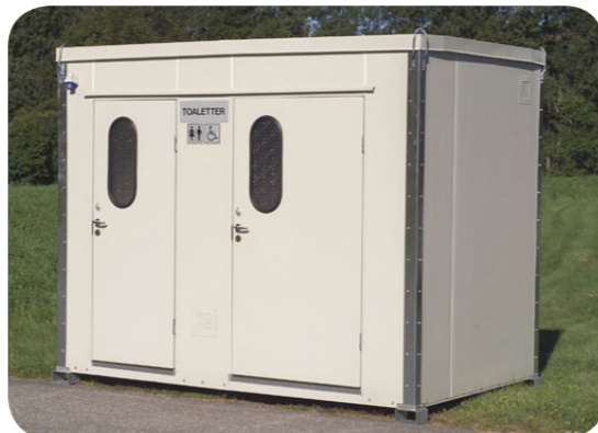
Doppel-Tankkabine Mobiltoilette mit Fäkalientank und zwei Toilettenräumen - einer davon für behinderte Personen angepasst.