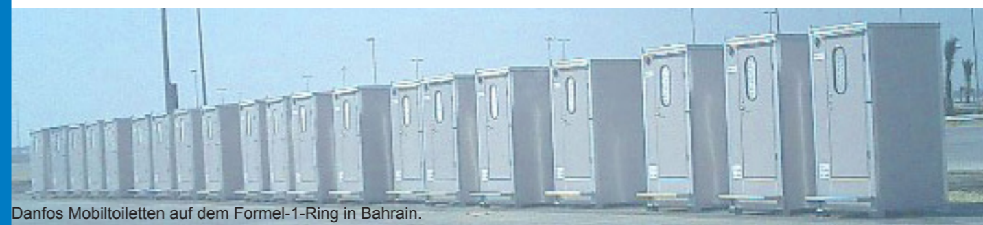
Danfoss Mobiltoiletten auf dem Formel-1-Ring in Bahrain.