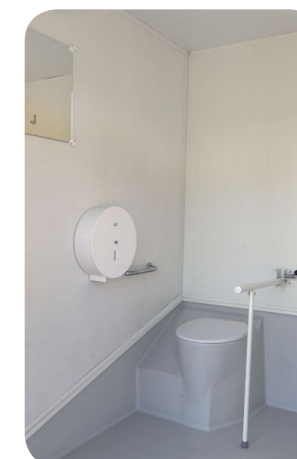
Doppel-Tankkabine -Raum für behinderte Personen