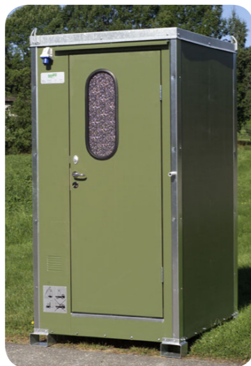
WC-Kabine Mobiltoilette für den Anschluss an das Frisch- und Abwasser-netz.